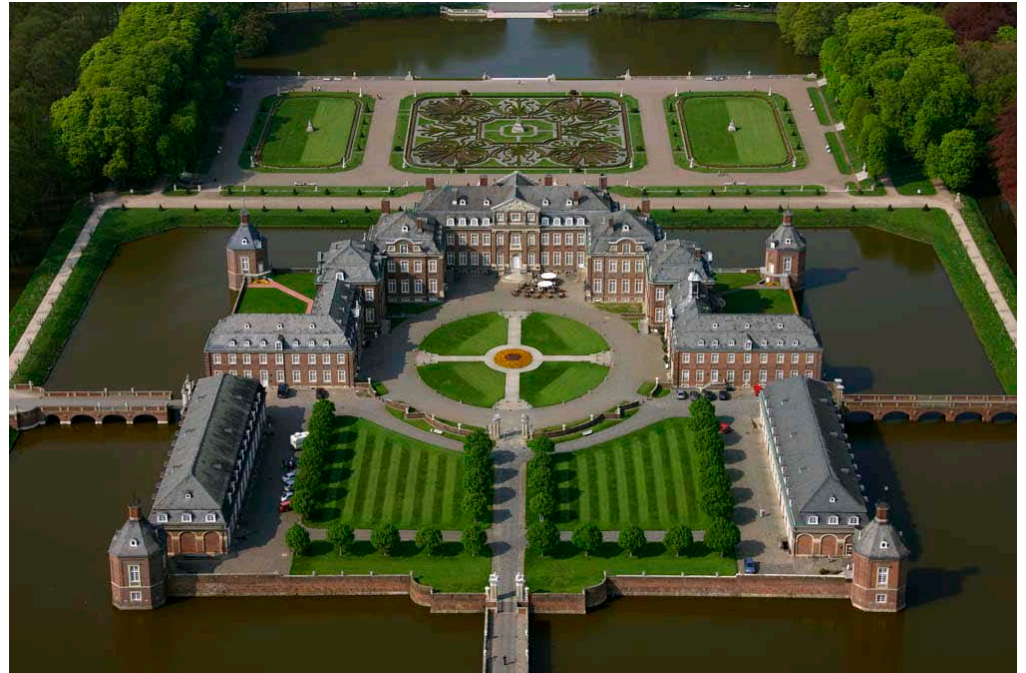
Westfälisches Versailles - Schloss Nordkirchen Fachhochschule für Finanzen