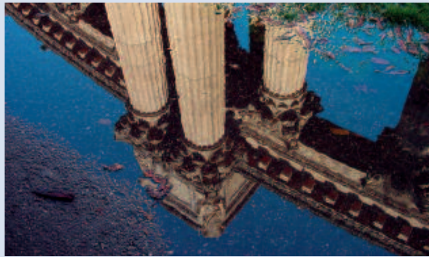
Noch bleibt das Drei-Säulen-Modell in Deutschland bestehen. Doch die Strukturen werden brüchig.

Auch ohne eine ausdrückliche gesetzliche Regelung ist ein Verkauf des Unternehmens Sparkasse grundsätzlich möglich. Dies kann mit denselben Argumenten, die bereits dem geplanten Verkauf der Sparkasse Stralsund zugrunde gelegen hatten,