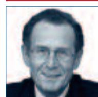
Prof. Dr. Dr. h.c. Bert Rürup, Professor für Finanz- und Wirtschaftspolitik an der Technischen Universität Darmstadt und Vorsitzender des Sachverständigenrates zur Begutachtung der gesamtwirtschaftlichen Entwicklung