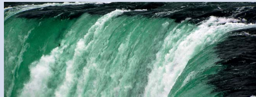
Das neue EnWG bewegt den gesamten Energiesektor.

und Regulierungsmechanismen fest. 166 Veröffentlichungspflichten kommen hinzu und sollen Transparenz gewährleisten. Schwer vorstellbar, dass diese gründliche Umsetzung der europäischen Vorgaben in deutsches Recht tatsächlich hilft, eine ganze Branche auf Trab zu bringen. Die einseitige Fokussierung des neuen Ordnungsrahmens auf den Netzbereich verkennt die wirklichen Hemmnisse eines funktionsfähigen Marktes.