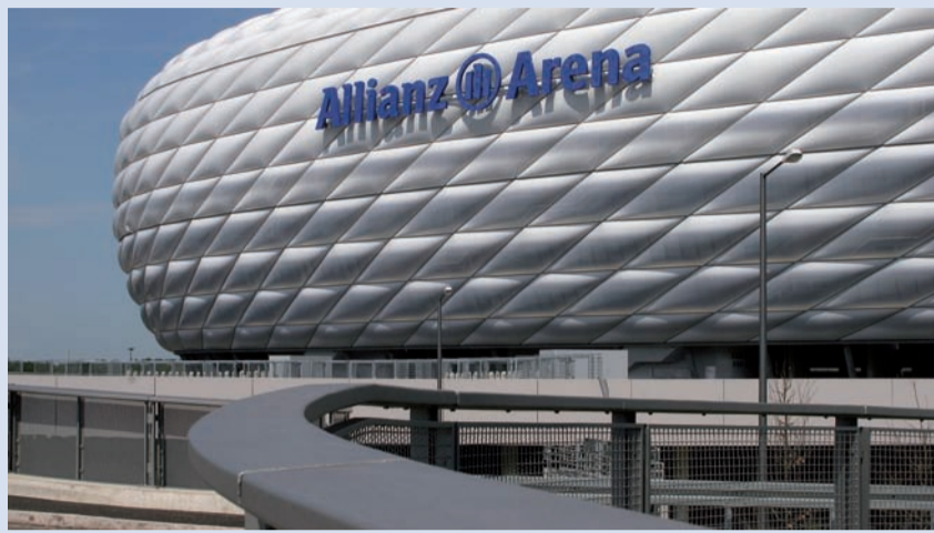
Eine Beschwerde bei der EU-Kommission verzögerte den Bau der Allianz Arena.

Der Begriff der Beihilfe ist, obwohl im Gemeinschaftsrecht nicht näher definiert, nach allgemeiner Ansicht weit auszulegen. Hierunter werden allgemein Maßnahmen verstanden, die durch den Transfer staatlicher Mittel die Belastung verringern, die