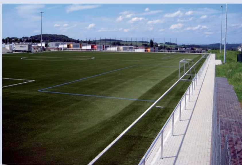
Der neue Sportplatz in Königswinter

Im Jahr 2003 diskutierten die politischen Gremien über den künftigen Standort des neuen Fußballplatzes. Schließlich schaffte die Stadt die planerischen Voraussetzungen für einen Fußballplatz in einem Gewerbegebiet in der Nähe einer neu erbauten Grundschule mit Dreifachturnhalle und Tribünenanlage für 800 Personen. Im Sommer beauftragte sie ein Planungsbüro damit, ein Konzept für den neuen Fußballplatz zu entwerfen und die Kosten zu berechnen. Für den Bau der Sportstätte sah die Stadt daraufhin 1,3 Millionen Euro im Finanzplan für das Jahr 2005 vor.