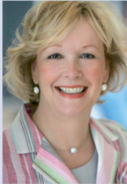
Gudrun Kopp, Sprecherin der FDP-Bundestagsfraktion für Energiepolitik sowie Mitglied im Beirat der Bundesnetzagentur

Starke Stadtwerke sind wichtig und haben Zukunft als kundennahe Regionalversorger und Gegengewicht zu dem Oligopol der „Großen Vier“. In diesem Zusammenhang ist es auch wichtig, dass ein effektives Kartellrecht einen wirksamen Schutz vor der Macht marktbeherrschender großer Anbieter garantiert. Verflechtungen