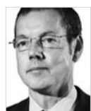
Professor Dr. Peter Bofinger, Mitglied Sachverständigenrat zur Begutachtung der gesamtwirtschaftlichen Entwicklung