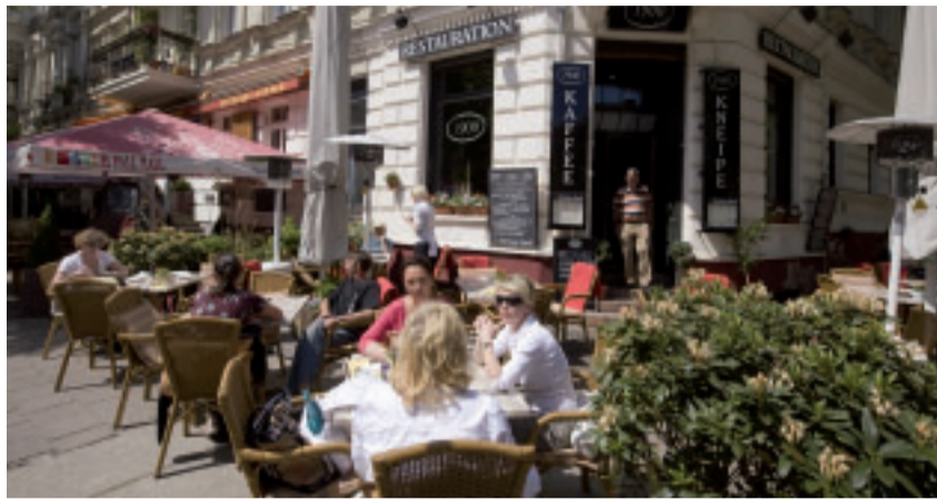
Wohlfühl am Prenzlauer Berg – früher heruntergekommener Stadtteil, heute attraktives Leben im Kiez