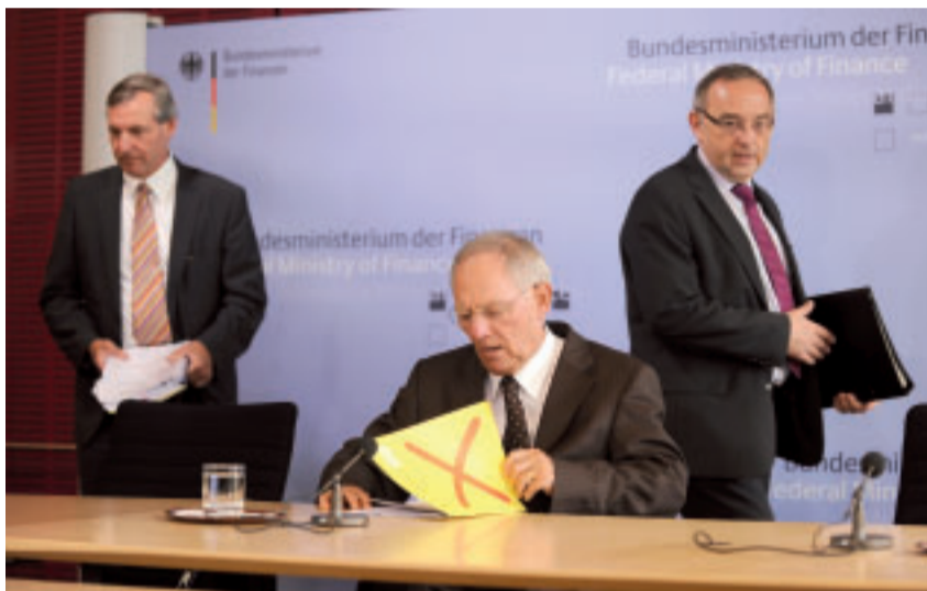
Bei den Steuern nichts Neues: Am Ende der Gemeindefinanzkommission gehen Städtevertreter Articus, Bundesfinanzminister Schäuble und NRW-Finanzminister Walter-Borjans ohne große Lösung auseinander.

Nach 15 Monaten harten Verhandlungen beendete am 15. Juni in Berlin die Gemeindefinanzkommission ihre Arbeit – ohne Einigung in der Hauptsache. Die Kommission war mit dem Ziel angetreten, das System der Kommunalsteuern neu zu ordnen. Im Mittelpunkt der Reformdiskussion stand die Gewerbesteuer. Die FDP blies zum Generalangriff. Sie wollte die Gewerbesteuer abschaffen. Als Kompensation sollten die Kommunen einen höheren Anteil an der Umsatzsteuer sowie eigene Hebesätze auf die Einkommens- und Körperschaftsteuer erhalten. Die Kommunen lehnten dieses Ansinnen jedoch strikt ab und fanden Unterstützung bei Bundesfinanzminister Schäuble. Dieser wollte keine Reform ohne Zustimmung der Kommunen. Und so bleibt in Sachen Gewerbesteuer alles beim Alten. Die Kämmerer sind erleichtert: Zwar sehen sie auch Unzulänglichkeiten bei der Gewerbesteuer. Die von der FDP favorisierte Lösung hätte aus ihrer Sicht aber alles nur noch schlimmer gemacht.