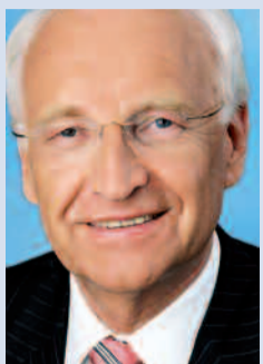
Dr. Edmund Stoiber ist Vorsitzender der High-Level-Group für Bürokratieabbau in Europa.

Die EU-Kommission ist bestrebt, auf dem Feld der öffentlichen Daseinsvorsorge vermehrt wettbewerbliche Mechanismen zu verankern. Der frühere bayerische Ministerpräsident Dr. Edmund Stoiber spricht sich im Interview mit dem Hinweis auf das Subsidiaritätsprinzip gegen diese Politik der Marktöffnung aus. So soll die Trinkwasserversorgung in kommunaler Hand verbleiben, wenn der nationale Gesetzgeber dies wünscht.