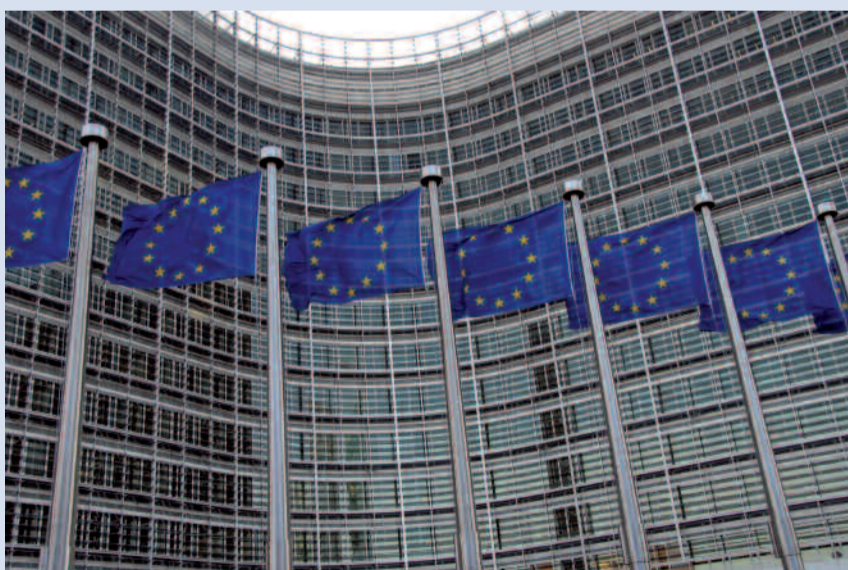
Hier sollten sich die Kommunen endlich mehr Gehör verschaffen: Das Berlaymont-Gebäude, Sitz der EU-Kommission in Brüssel.

Zu Recht sind die kommunalen Spitzenverbände mit dem EU-Reformvertrag zufrieden. Im Oktober 2008 begrüßten sie in einer gemeinsamen Deklaration mehr Bür-