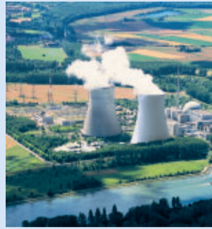
Die Verlängerung der Restlaufzeiten von Kernkraftwerken wie dem AKW Philippsburg stellt für die Stadtwerke ein Wettbewerbsnachteil dar.

Der im Koalitionsvertrag angekündigte Energiedialog 2010 sollte frei von alten Denkmustern rasch begonnen werden. Ein zentraler Baustein muss eine Strategie sein, wie die für langfristige Investitionen der Stadtwerke notwendige Planungssicherheit und öffentliche Akzeptanz er-